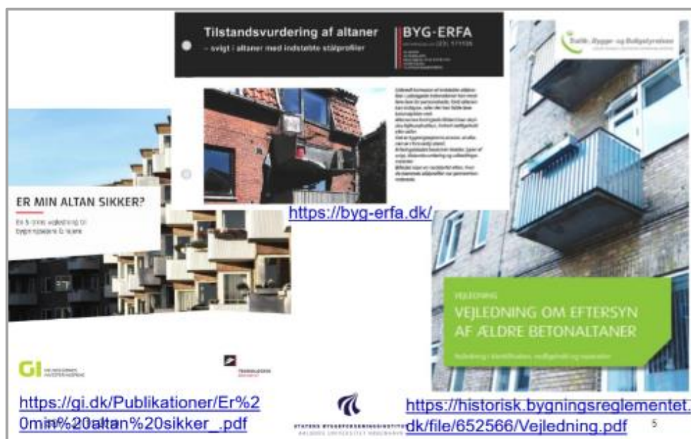
Planche 5: Byggeparter, ejere og brugere har adgang til forskellige informationer om krav til altaners sikkerhed, eftersyn og vedligeholdelse.