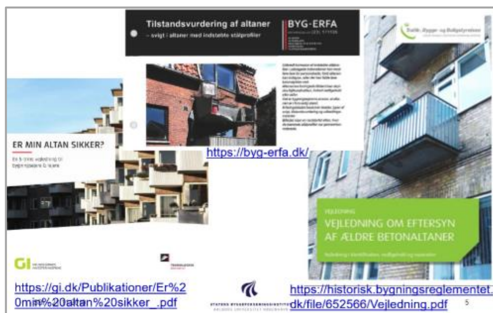
Planche 5: Byggeparter, ejere og brugere har adgang til forskellige informationer om krav til altaners sikkerhed, eftersyn og vedligeholdelse.